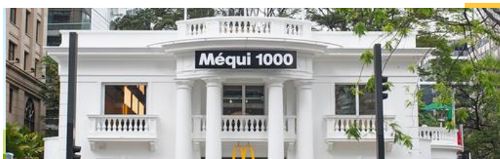
Restaurante insinia "Méqui 1000" - San Pablo

Click aquí para acceder a nuestro Reporte de Compromiso Social y Desarrollo Sustentable.