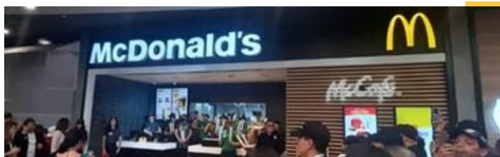
Restaurante insignia - Sambil, La Candelaria.

Click aquí para acceder a nuestro Reporte de Compromiso Social y Desarrollo Sustentable.