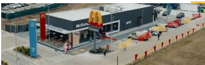
Restaurante insignia - CON

Click aquí para acceder a nuestro Reporte de Compromiso Social y Desarrollo Sustentable.