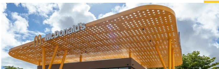
Restaurante insignia - San Patricio, Guaynabo.

Click aquí para acceder a nuestro Reporte de Compromiso Social y Desarrollo Sustentable.