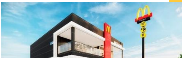
Restaurante insignia - Santa Patricia, Lima.

Click aquí para acceder a nuestro Reporte de Compromiso Social y Desarrollo Sustentable.