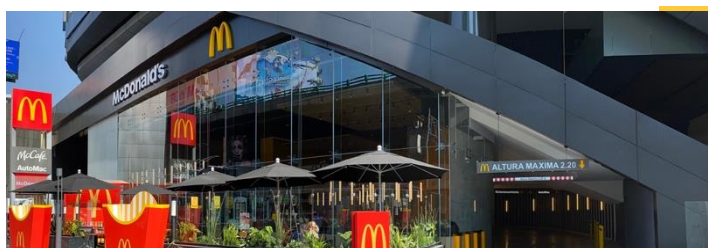
Restaurante insignia - Polanco, Ciudad de México.

Click aquí para acceder a nuestro Reporte de Compromiso Social y Desarrollo Sustentable.