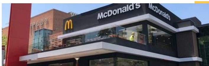
Restaurante insignia - "Kennedy", Santiago.

Click aquí para acceder a nuestro Reporte de Compromiso Social y Desarrollo Sustentable.