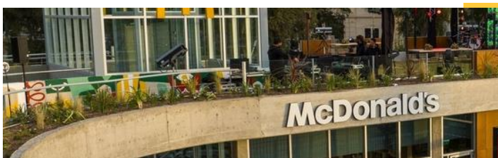
Restaurante insignia - Rosario, Santa Fe.

Click aquí para acceder a nuestro Reporte de Compromiso Social y Desarrollo Sustentable.