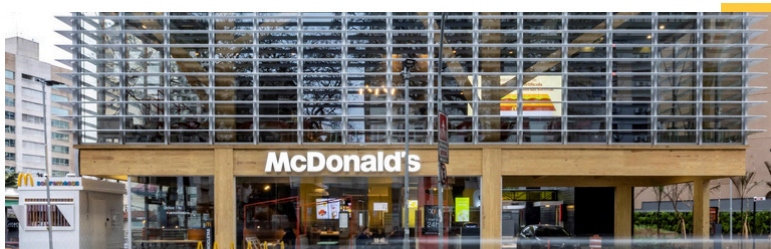
Restaurante insignia - São Paulo Brasil

vendidos en 2025 en nuestra campaña solidaria, recaudando fondos para las Casas Ronald y diversas ONG de la región.